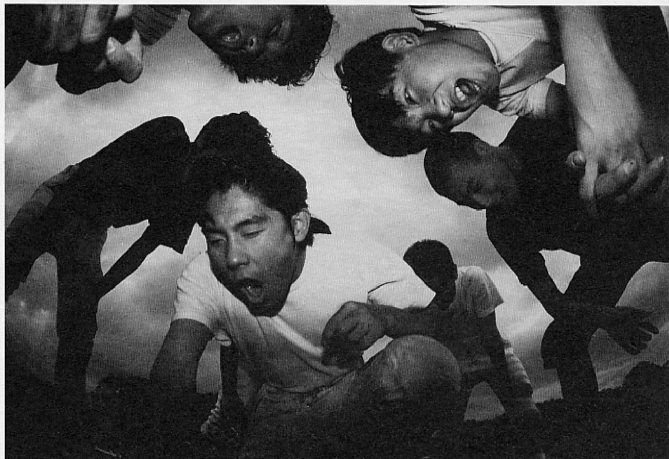
撮影 高橋 徹也さん(宮寺)