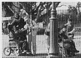
●車椅子で参加できるトレイルオリエンテーリング