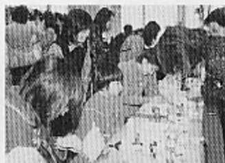
●賑わう展示コーナー