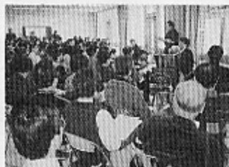
●盛況なミニ講演会

今回は、「協働」というテーマを掲げ「市民、企業、行政が、これからの入間をともに考えていこう」という主旨で展開されました。「福祉」「環境」をテーマにしたミニ講演会、「教育」「まちづくり」に関する公開ディスカッションや、各サークルの作品展示、販売、ステージ公演など、多彩なイベントとなりました。