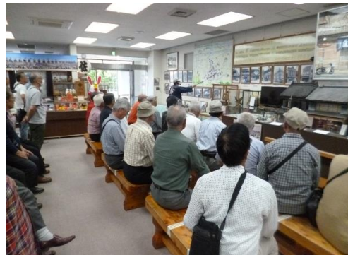
佐原町並み交流館