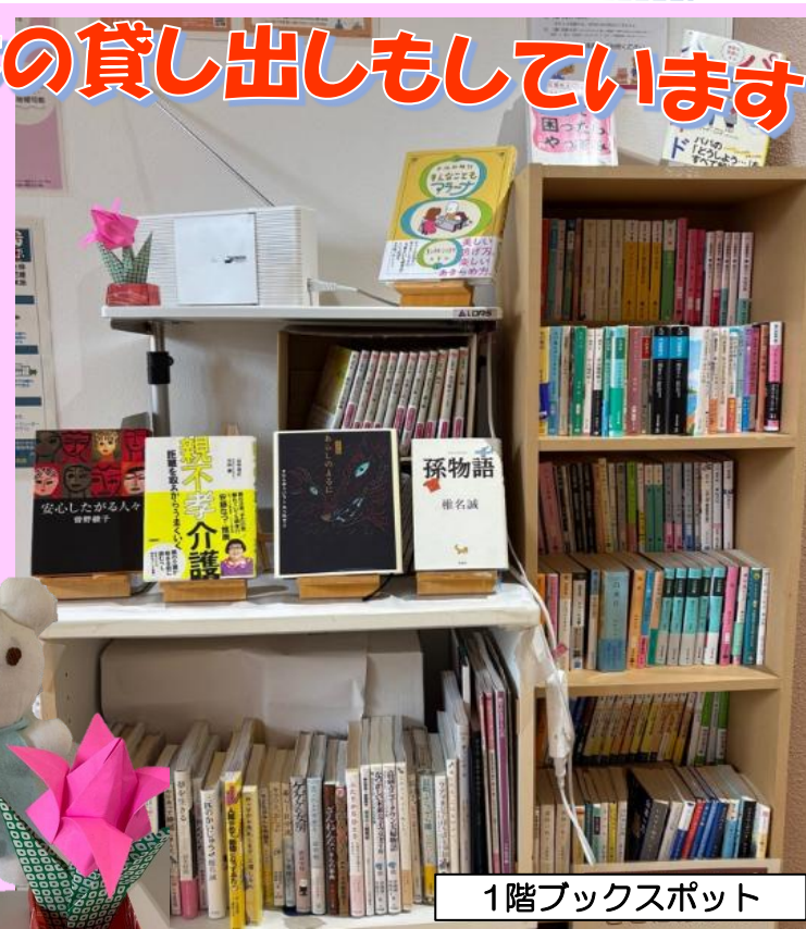
1階ブックスポット