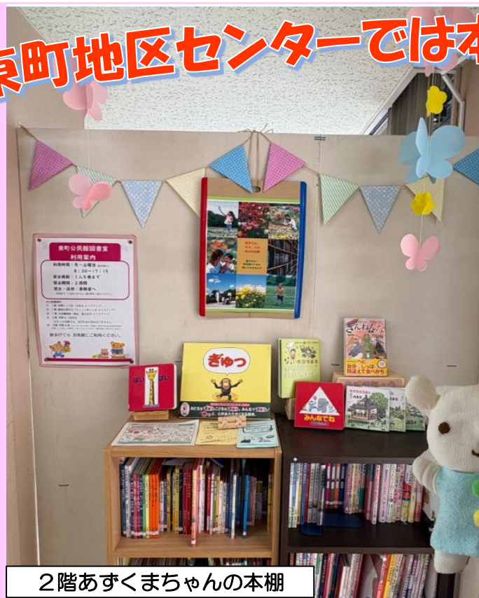
2階あずくまちゃんの本棚