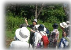
前回の植物散歩(森林公園)の様子です