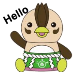
市公式キャラクター いるティール

*養成講座終了後も毎週金曜日に話し合いを継続し、高齢者の通いの場を立ち上げる予定です*