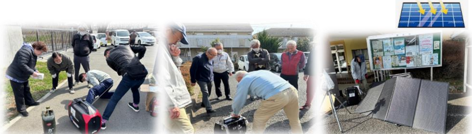
★東町防災倉庫 (入間基地東町門前)での点検

豊岡地区自主防災連絡会では災害に備えて、発電機等を動かして防災備品の点検を行っています。 東町防災倉庫、黒須防災倉庫それぞれの防災倉庫で3月に点検を行いました。点検は各自主防災会長（各区・自治会長）を中心に、地域の防災・減災のために日頃から備えています。