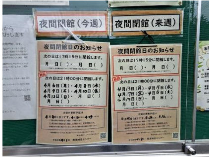
黒須地区センター（外掲示板）

令和8年4月より21時以降に施設予約がない場合は、21時に閉館となります。黒須地区センターでは外掲示板及び施設内ポスターで夜間閉館日を確認することができます。高倉分館でも同様に掲示してあります。また、市公式ホームページ等でも確認できます。なお、17時以降の夜間閉館も継続中です。