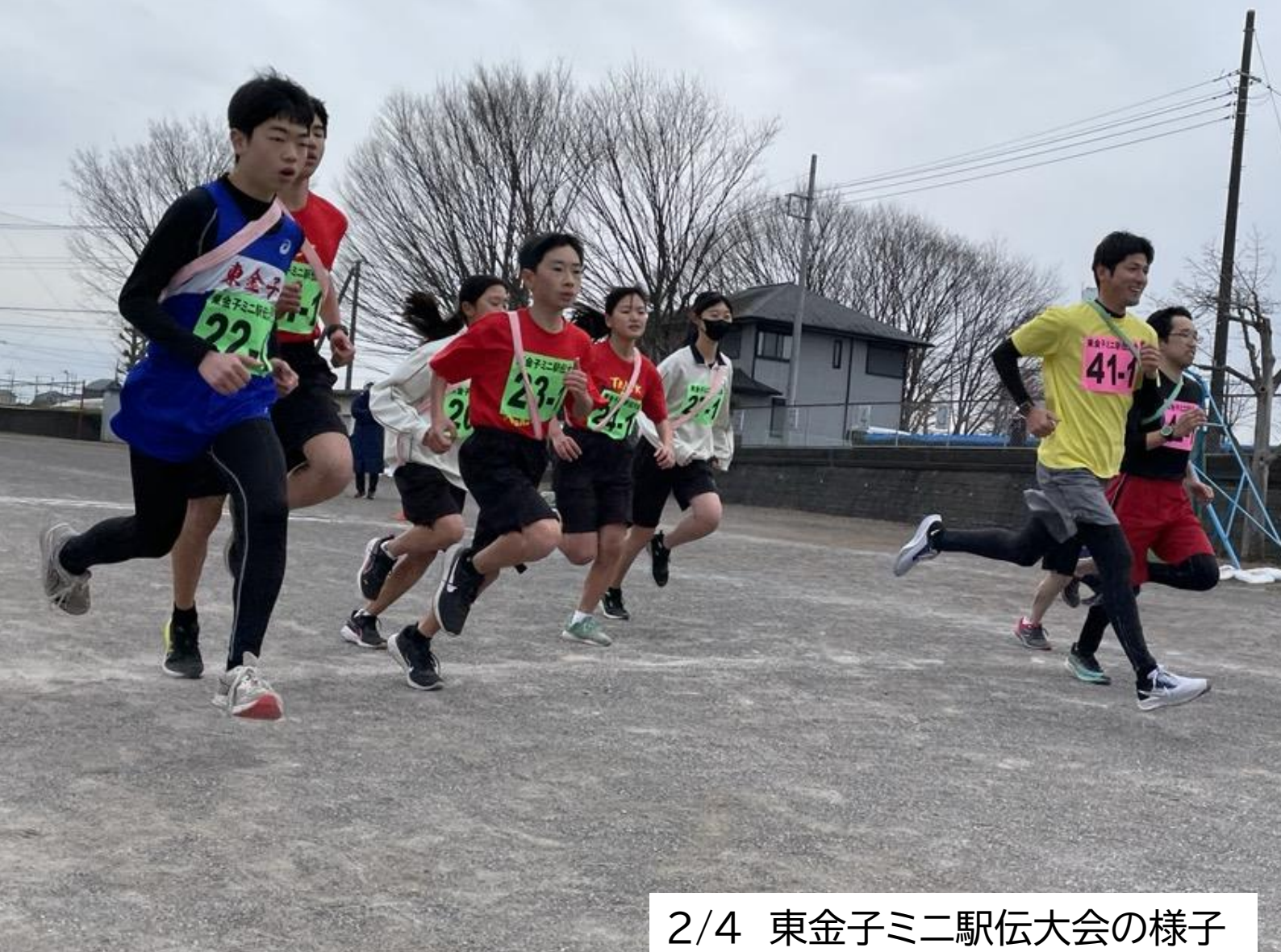
2/4 東金子ミニ駅伝大会の様子