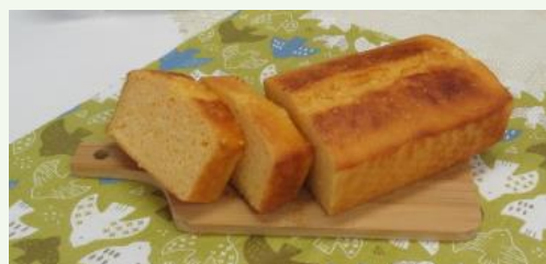
試作品で作った 「ヨーグルトパウンドケーキ」