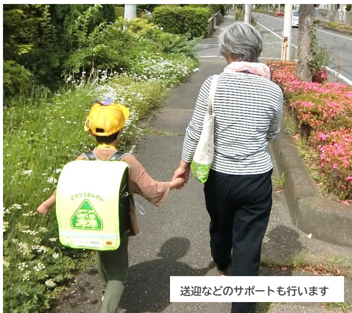
送迎などのサポートも行います

両方会員：ファミサポに自身も登録され、サービスも利用されている方。 提供会員：ファミサポに登録され、サービスを提供されている方。