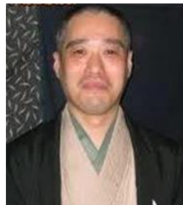
たてかわ しゅう 立川 志遊

略歴 1967年5月17日生まれ 東京都北区赤羽出身 1991年七代目立川談志に入門 2009年6月真打昇進